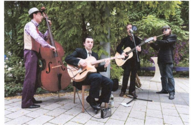
Konzert: Das Berliner „SpreeTONorchester“

Ausstellung „Der Gelbe Stern“ des Antikriegsmuseums/Friedensbibliothek